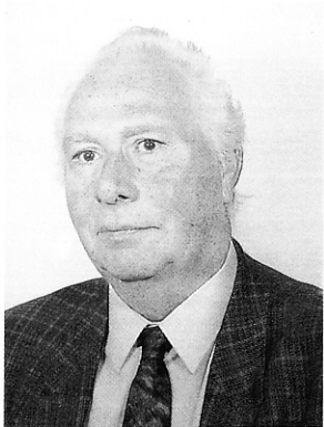
Grußwort des Schirmherrn Günter Haas